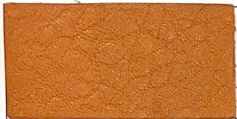
N° 13 : Orange / Orange