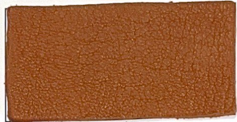
N° 12 : Marzipan / Marzipan