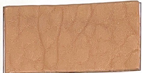
N° 14 : Dusty Pink / Vieux Rose