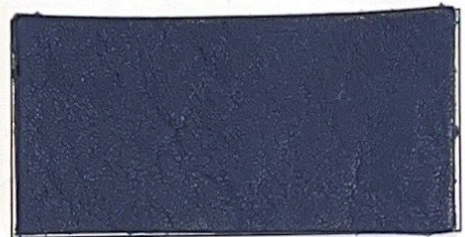
N° 16 : Navy / Marine

Taille/douz - Size per doz : 72/74 sqft/dozen Epaisseur - Thickness : 1,2/1,5 mm Qté minimum - MOQ : 50 SQM 500 Sqft