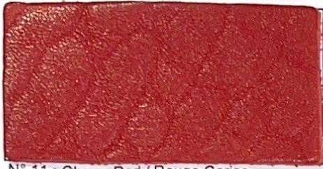
N° 11 : Cherry Red / Rouge Cerise