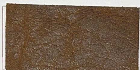
N° 10 : Havane

Taille /doz - Size per doz : Epaisseur - Thickness : Qté minimum - MOQ : 50 SQM 500 Sqft