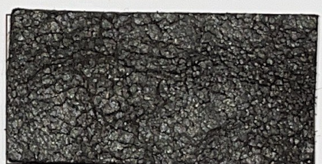
N° 08 : Dark brown