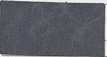
N° 03 : Océan