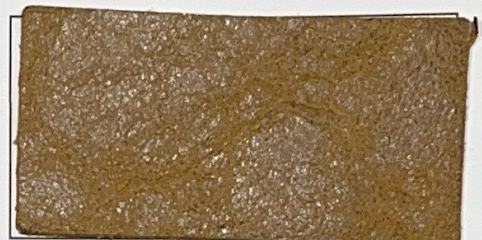
N° 04 : Beige