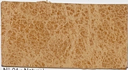
N° 01 : Naturel