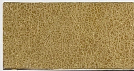
N° 05 : Ivoire