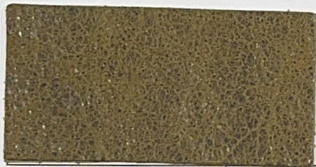
N° 07 : Olive