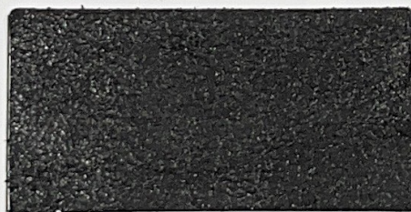
N° 09 : Noir