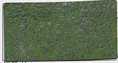
N° 02 : Vert