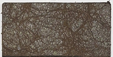
N° 06 : Medium brown