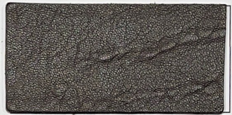
N° 04 : Dark brown