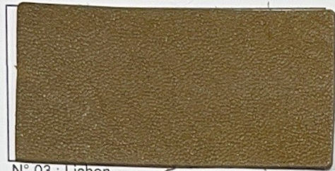
N° 03 : Lichen