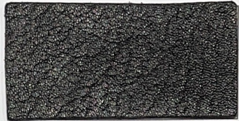
N° 02 : Noir