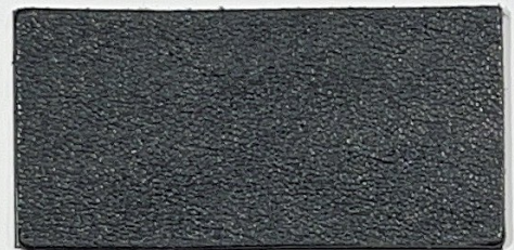
N° 05 : Navy