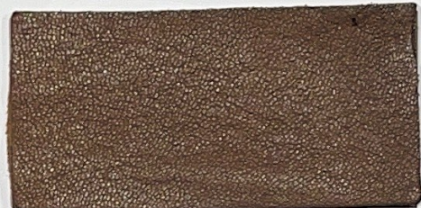
N° 06 : Medium brown