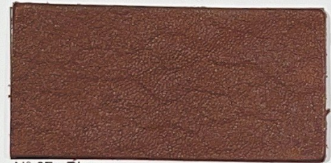
N° 07 : Rhum