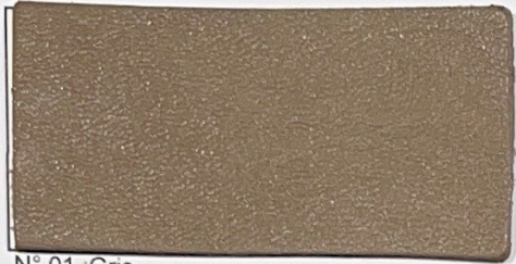
N° 01 : Gris