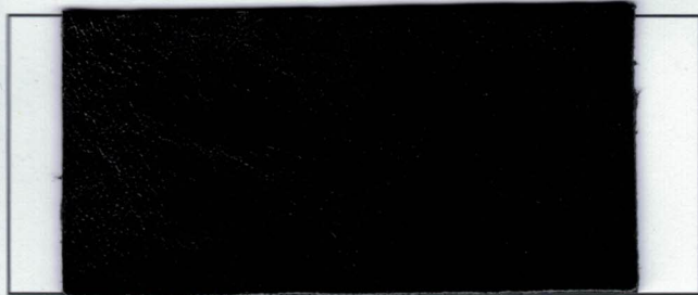
N° 07 : Black Noir