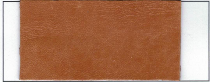
N° 06 : Fawn Fauve