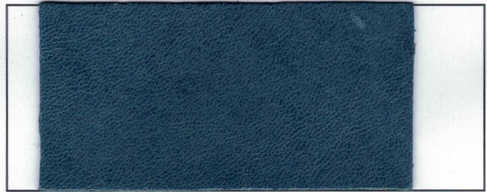
N° 02 : Navy Blue Bleu