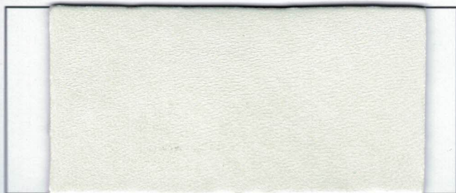
N° 09 White Blanc