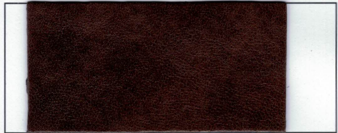
N° 04 Rhum