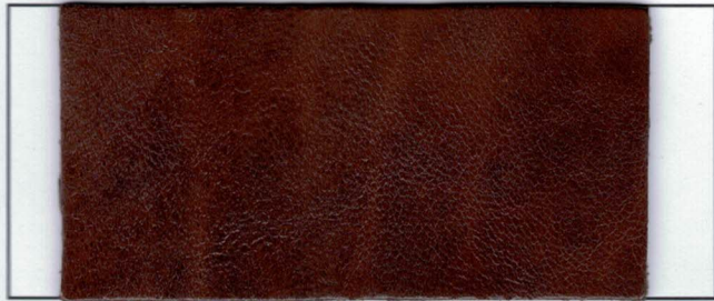
N° 05 Dark brun Marron