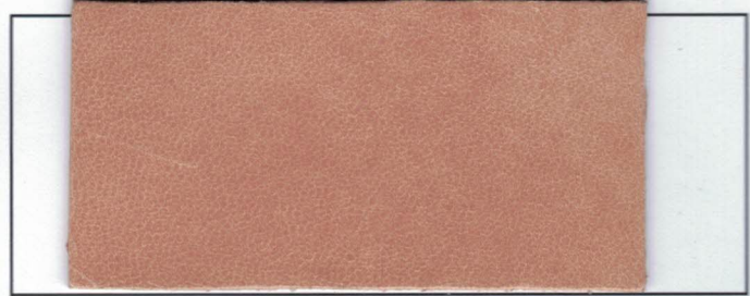
N° 08 : Natural naturel