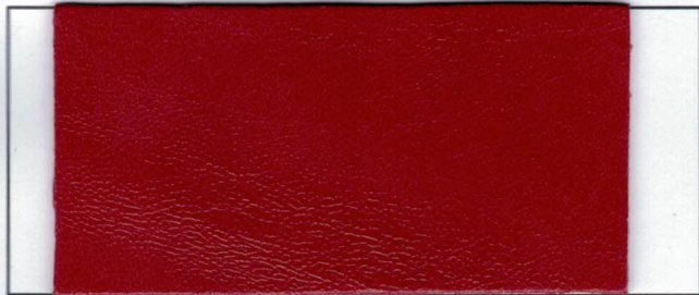
N° 03 : Red Rouge