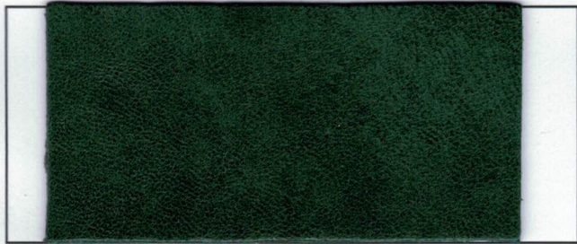
N° 01 : Forest green Vert