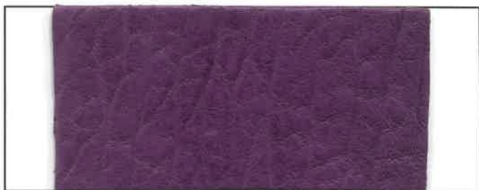
N° 14 Ultraviolet