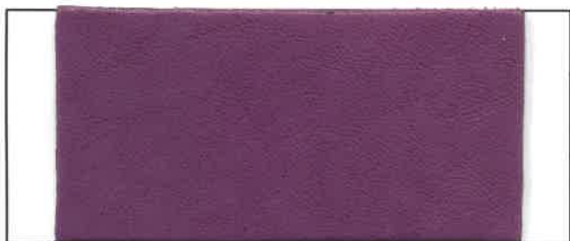
N° 15 Lupin