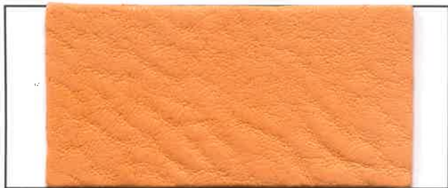
N° 13 : Mandarine / Tangerine