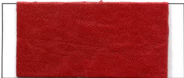
N° 11 : Cerise/Cherry