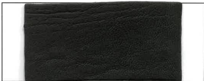
N° 12 : Sapin / Forest green